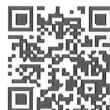
PECS薬剤師ログイン画面