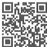
薬剤師生涯学習達成度確認試験ページ

(2)申込方法：当財団ホームページ( https://www.jpec.or.jp/ )上の「PECS(薬剤師研修・認定電子システム)」から受け付けています。申込手順は、当財団ホームページをご確認下さい。